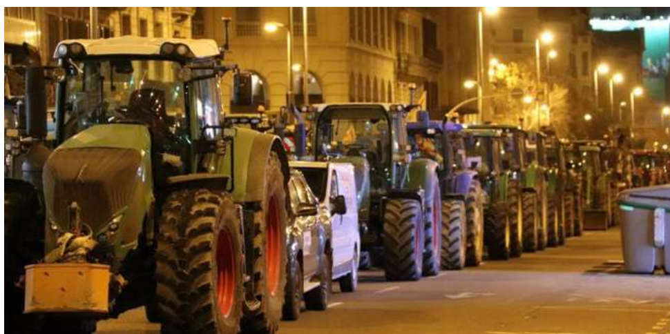
Els pagesos tornen cap a casa després de les mobilitzacions a Barcelona el passat 7 de febrer.

Com bé diu el clam de la pagesia i la ramaderia: “La seva fi, la nostra fam”.