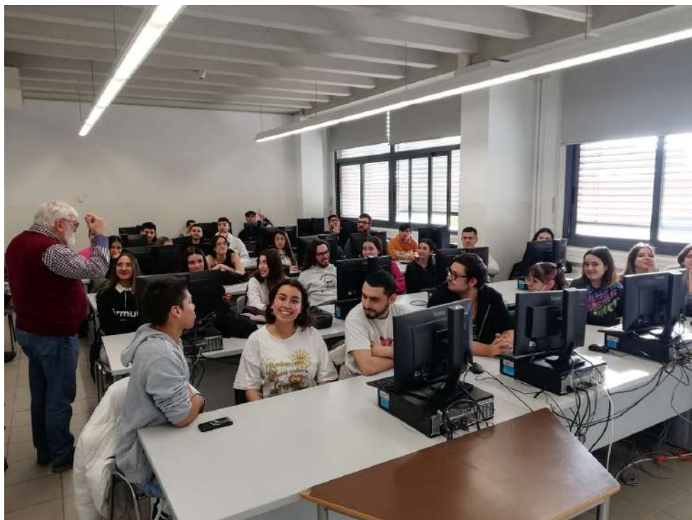
L'alumnat rebent l'explicació teòrica prèvia al treball al laboratori.