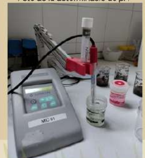
Foto de la determinació de pH

Els anàlisis químics previstos són: la matèria orgànica, el nitrogen, el fòsfor i els metalls pesants.