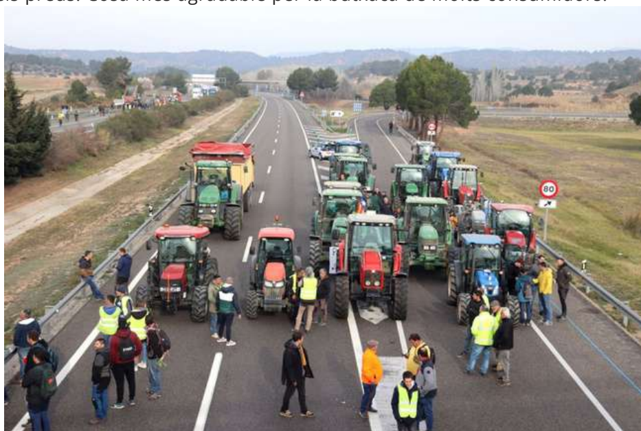
Tractors tallant l'autopista AP-2 a Montblanc el passat 6 de febrer.

Però ara ens anem al supermercat i veiem, per exemple, unes pomes de proximitat a un preu determinat. Al costat, unes altres pomes a un preu molt inferior que provenen de països externs a la Unió Europea. Com és això possible? Doncs bé, així com Europa exigeix uns mínims de qualitat als productes generats al territori europeu, no fa el mateix pels productes importats. Per suposat, aquesta mancança de control fa que els costos de producció d'aquests productes siguin molt menors i, per tant, també ho siguin els preus. Cosa més agradable per la butxaca de molts consumidors.