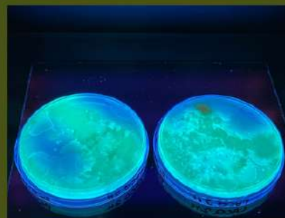
Foto del resultat de l'anàlisi de pseudomonas