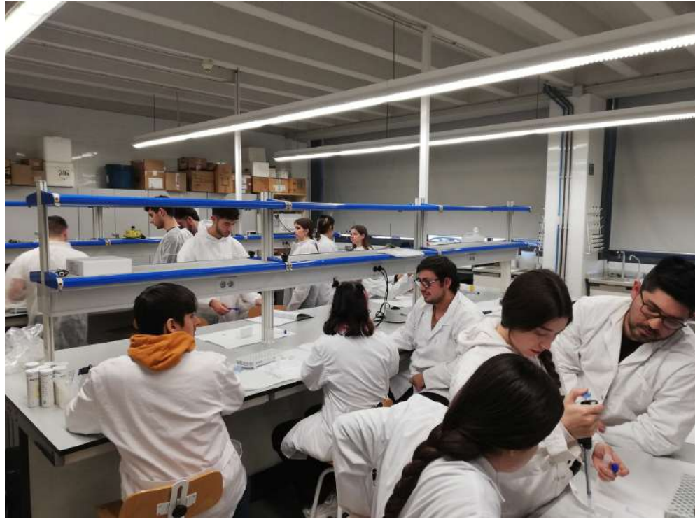
En plena feina!

La valoració d'aquesta sortida tècnica és molt positiva ja que no solament va servir per a que l'alumnat aprengué noves tècniques de laboratori de bioquímica o nous conceptes, sinó també per repassar aquells continguts ja treballats a classe. A més a més, va ser una bona oportunitat per a conèixer de primera ma uns laboratoris universitaris així com els seus equipaments.